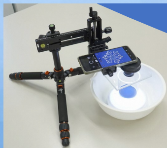
きれいにとれるかな!