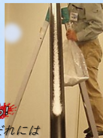
なだれには あたまとしっぽがあるんだって!